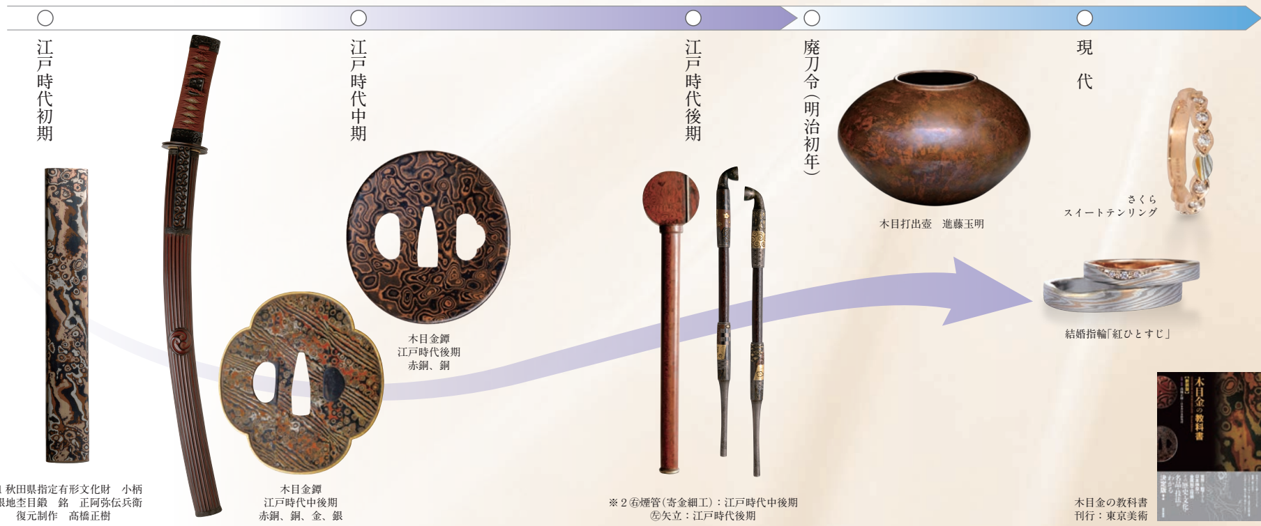
※1 秋田県指定有形文化財 小柄 金銀地杢目銀 銘 正阿弥伝兵衛 復元制作 高橋正樹