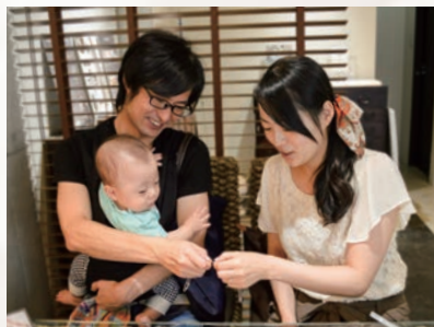
ノベルティの錫チャームの分ちあい体験をされるおふたりの姿に、お子様も興味津々のようです