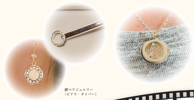
鏝ペアジュエリー (ピアス・タイバー)

ご結婚10周年の記念に、おふたりで「鏝ペアジュエリー」をお作りいただきました。お受取当日は奥様だけのお越でしたが、旦那様が日頃の感謝を込めて内緒でオーダーされていた2017年イヤープダントをお渡しすると、ビックリ！「今回のサプライズは全然気づかなかった」ととても感激されていました。