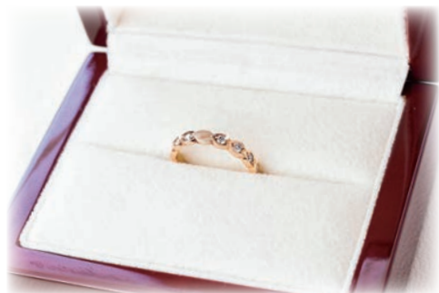
さくらスイートテンリング

ご結婚10周年記念にふさわしいスイー トテンジュエリーも多数ご覧いただけます。 ご予約なしでもご自由にご覧いただけます ので、お気軽にお越し下さい。