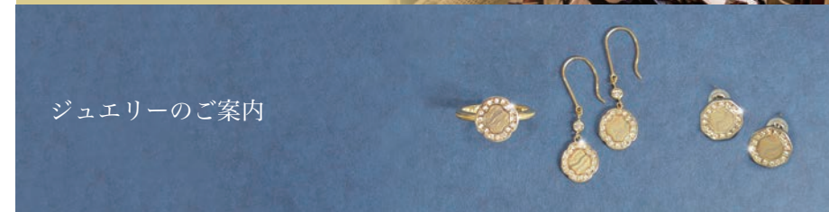
ジュエリーのご案内