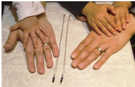
リングの一部をお子さまのペンダントに

私達の結婚指輪の一部ずつを子ども達に受け継いでゆけるというのは家族のジュエリーとして、とてもいい記念になると思いました。夫婦のつながりが子ども達とのつながりにも広がる気がします。