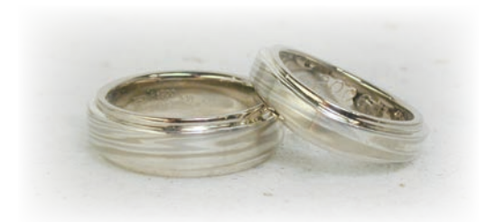
毎年結婚記念日にメンテナンスされている結婚指輪