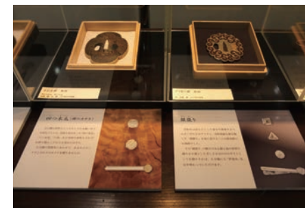
復元研究のパネル展示などもご覧いただけます