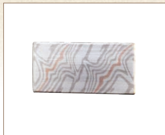
同じ木目金の板から