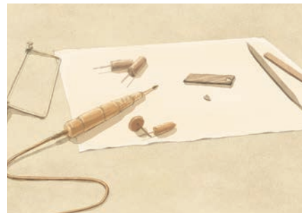
ご予約方法はP.25をご覧ください