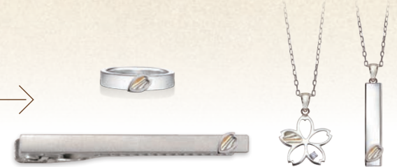
職人が記念日のジュエリーにお仕立てします