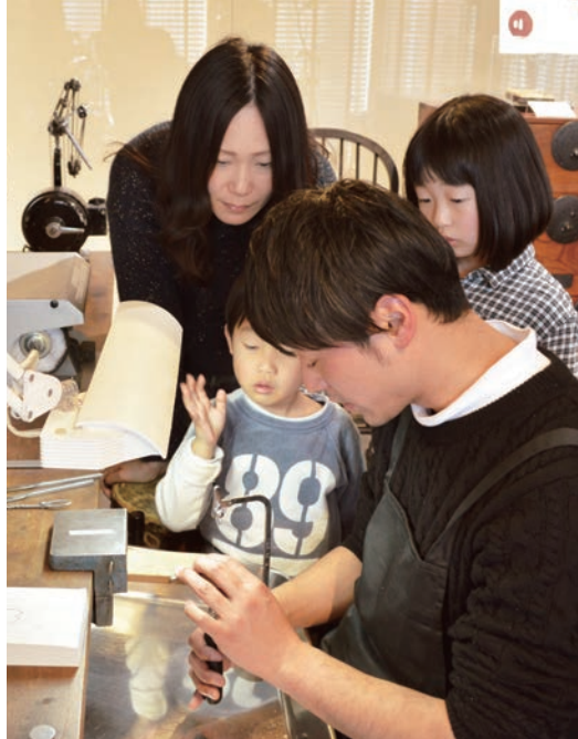
さくらスイートテンリング

結婚10周年で妻にスイートテンリングを贈ろうと探していた中「さくらだより」が届き、「自分でつくる」というコンセプトに「これしかない!」と思い即決でした。