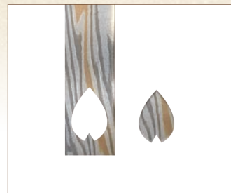
一枚の桜の花びらを切り出します