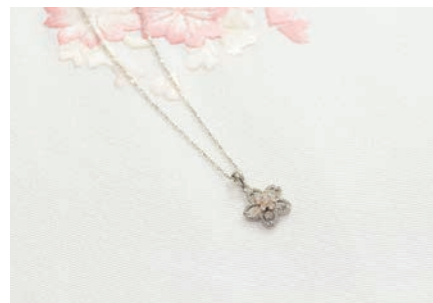
プレゼントに最適なジュエリーをご用意いたします