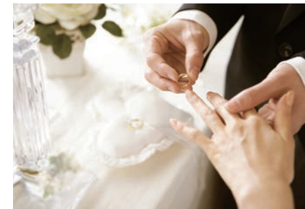
その場で職人がみがき上げます(P.22～23)