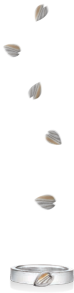
さくらベビーリング