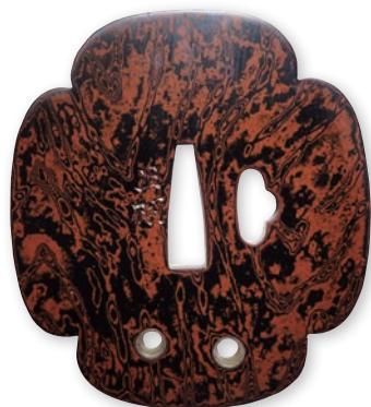
わかしちくめがねじつば 「鑲木目地鐔 銘 江府之住人正道作」の復元 江戸時代後期 赤銅・素銅 銘 正樹

杓目金屋では、毎年江戸時代の名品の鐔を復元し日本美術刀剣保存協会が主催する「新作名刀展」に出品しています。昨年 の 復元制作の様子 は 今年 の 1月にNHKの番組「美の壺」でも紹介されました。