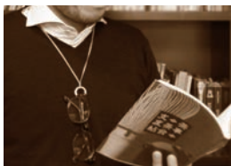
【グラスホルダー】¥32,400(税込) WG×PG×Sv, シルクコード

一枚の木目金の板からお作りでき、ペアジュエリーとして普段ジュエリーを身に付けない方への贈り物としても人気。