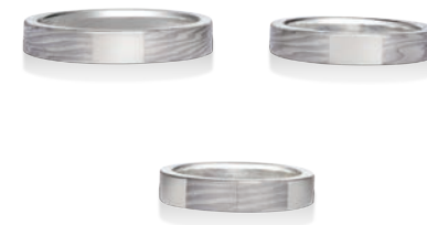
【木目金ベビーリング】 ¥70,200(税込)~ WG×PG×Sv