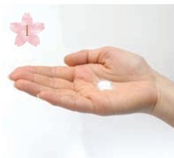
1 重曹を少量手に取ります Prepare the cleaning powder. (one teaspoon)