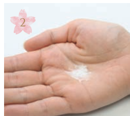
2 重曹を水につけます Add water to ①