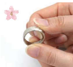
4 水につけながら 軽くこすり洗いをします Rub it lightly while soaking water.