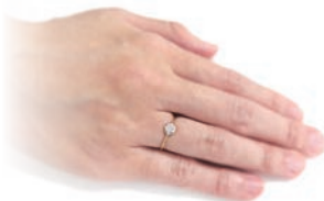
誕生石リング ¥42,120(税込) (ダイヤモンドのみ ¥51,300(税込)) PG×Sv, WG×Sv, YG×Sv