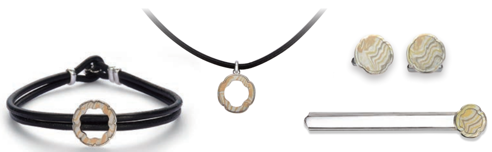
左から：【鐿プレスレット】¥35,640(税込) PG×WG×Sv、革 【鐿ペンダント】¥31,320(税込) PG×Sv、革 【鐿カフス】¥48,600(税込) YG×PG×WG×Sv 【鐿タイバー】¥50,760(税込) YG×WG×Sv

一枚の板から作られた結婚指輪を身に付けてきた10年。 ふたりで歩んできた時間の記念に、結婚指輪と同じように、一枚の板から作られたジュエリーをお揃いで身に着ける。 木目金の模様がこれからもおふたりをつなぎます。