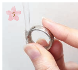
5 流水でよく洗い流します Wash it away well by a current.