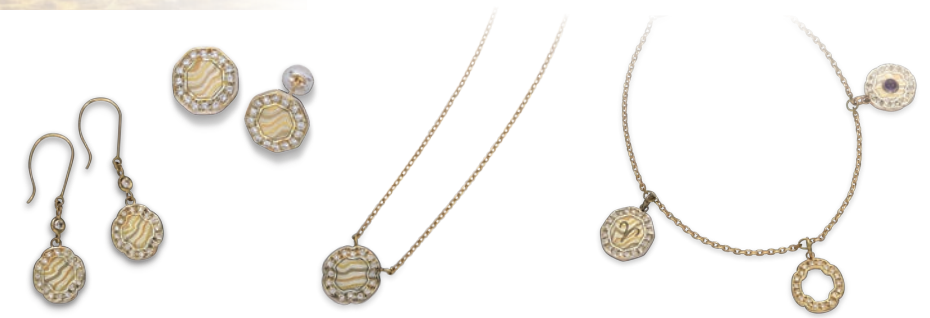
左から：【鐿ピアス】¥165,240(税込) YG×PG×WG×Sv 【鐿ピアス】¥190,080(税込) YG×PG×WG×Sv、ダイヤモンド 【鐿ペンダント】¥89,640(税込) YG×PG×WG×Sv、ダイヤモンド 【鐿プレスレット】¥282,960(税込) YG×PG×WG×Sv 裏面YG ダイヤモンド、アメシスト