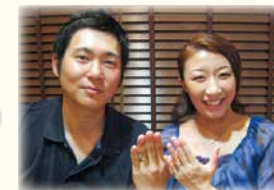
ご結婚当時のお写真とご結婚指輪