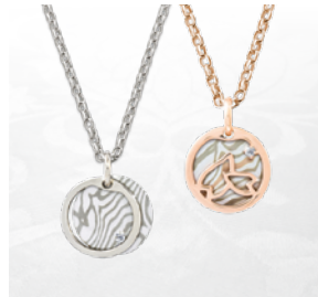
木目かさねペンダント K10: ¥35,200(チェーン・宝石代別・税込)