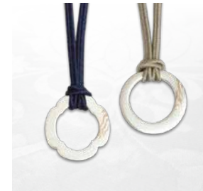
グラスホルダー ¥33,000(税込)