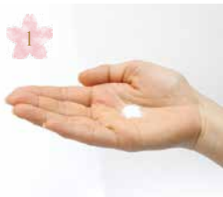
重曹を少量手に取ります Prepare the cleaning powder. (one teaspoon)