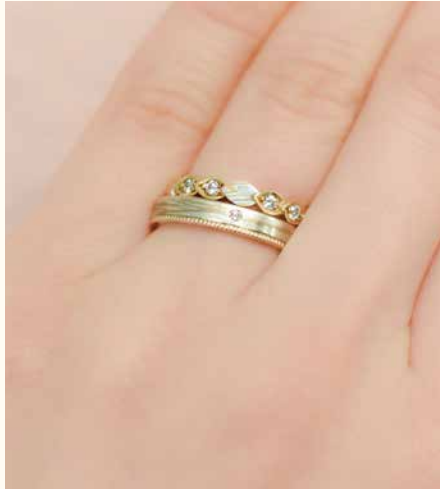
イエローゴールド