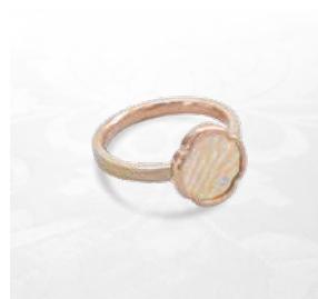
鐿リング 腕単色: ¥156,200(税込) 腕木目金: ¥189,200(税込)