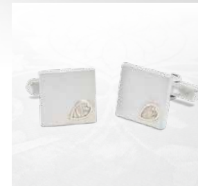
さくらカフス ¥70,400(税込)