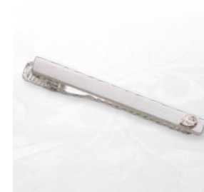
さくらタイバー Sv: ¥57,200(税込)