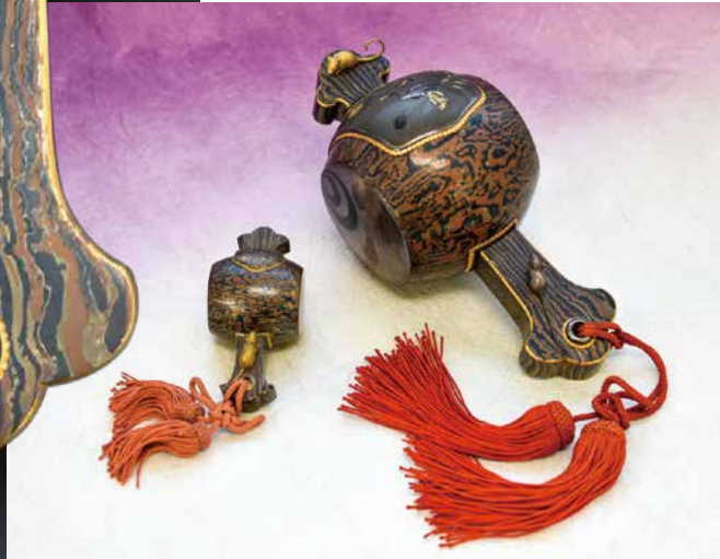
木目金地 打ち出の小槌 明治時代 銅、赤銅、四分一、真鍮、金象嵌

お正月にふさわしい招福のシンボル「打ち出の小槌」。「夫婦鶴」や「亀」「松」といった「おめでたづくし」のモチーフで彩られた逸品についてご紹介します。