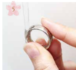
流水でよく洗い流します Wash it away well by a current.