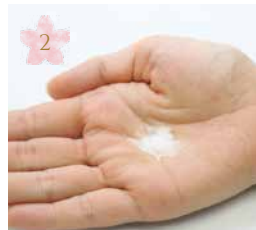
重曹を水につけます Add water to ①