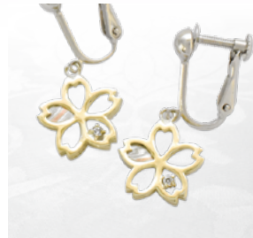
桜かさねイヤリング(さくら) ¥96,800(税込)