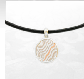
鐿メンズペンダント ¥35,200(税込)