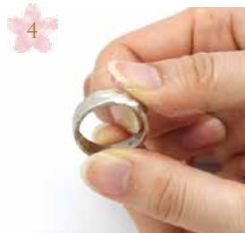
水につけながら 軽くこすり洗いをします Rub it lightly while soaking water.