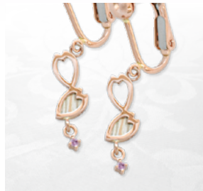
桜かさねイヤリング(花びら) ¥94,600(税込)