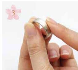
ぬらした重曹をリングの 表面にぬります Put ② to your ring.