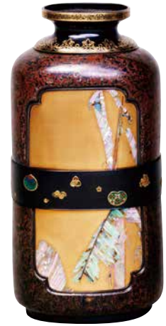
花瓶 明治時代 銅、金漆、螺鈿、赤銅、金象嵌、七宝 ヴィクトリア&アルバート博物館蔵

この小槌は木製であらわされることが多いのですが、今回ご紹介するのは木目金で作られ、金銀の象嵌が施された大変豪華なものです。大小どちらの小槌も持ち手の部分は、銅、赤銅、四分一（銅と銀の合金）の3色が重なる縞模様の木目金により作られています。槌の本体の木目金は、同じ積層にさらに大胆に彫りを加え、複雑で豪壮な雰囲気をもたせた模様になっています。大きい方の小槌には一生添い遂げる夫婦円満を象徴する「夫婦鶴」と長寿のシンボルである「亀」や「松」が象嵌されています。この小槌の大きさは全長が22センチ、本体の横幅が9.5センチです。わずかに数センチの鶴や亀は繊細な高度な細工により作られ、小さいながらリアルな存在感を醸し出しています。大胆な模様の木目金の地と組み合わせることで、豪華さが際立つ装飾となっています。また、大小どちらの小槌にも大黒様の使いと言われる愛らしい金