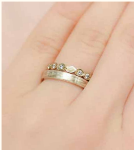
ホワイトゴールド