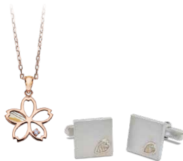
桜かざねペンダント K10の場合 / ¥35,200(税込) ※チェーンは別途 桜カフス ¥70,400(税込)