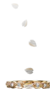
さくらスイートテンリング (ご結婚10周年のお客様限定商品) K18の場合 / ¥220,000(税込) Ptの場合 / ¥264,000(税込) ※10周年の方は上記の価格より10万円割引となります。 ダイヤモンド / 1/40×10個(価格に含む) リング / Pt・WG・PG・YG・GGからお選びいただけます。