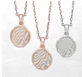
鐿ペンダント K10: ¥35,200(チェーン・宝石代別・税込)