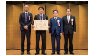
経済産業副大臣に「つながるカタチ」の分かちあいを体験していただきました