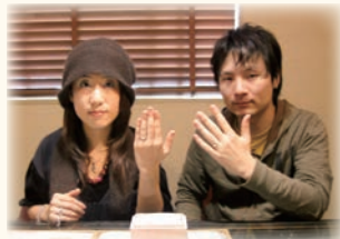
ご結婚当時のお写真とご結婚指輪