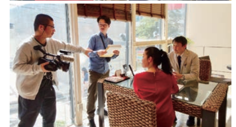
㊨制作現場 ㊩表参道本店