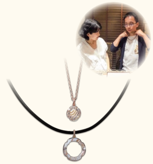
鐿ヘアジュエリーとご試着の様子