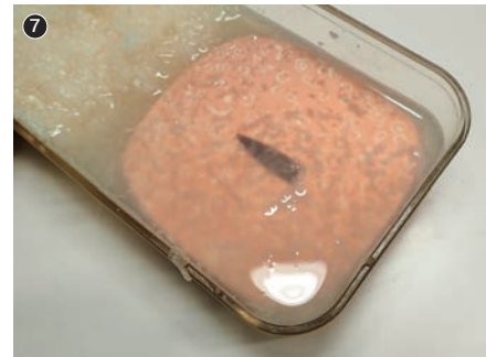
大根おろしに漬ける