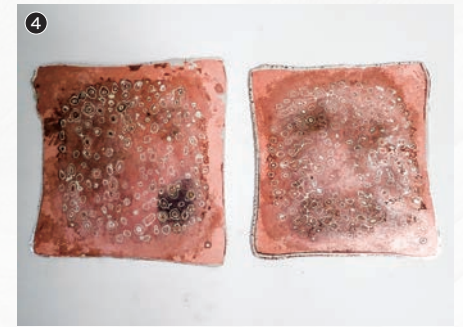
延ばし平らにする