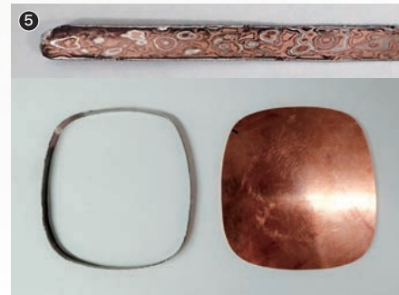
鐔中身の彫素材に覆輪を巻く