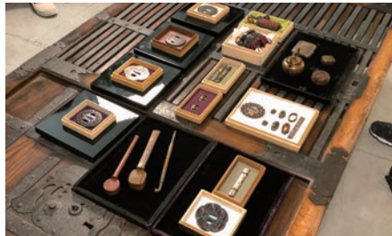
㊦木目金の業匠の撮影の様子 ㊧木目金の収蔵品の数々