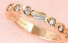
さくらスイートテンリング

10周年記念にふさわしい“さくらスイートテンリング”をはじめ 様々なスイートテンジュエリーを展示しておりますのでぜひご覧ください。 ご検討中のお客さまはご予約なしでもご自由にご覧いただけます。