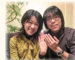
ご結婚当時のお写真とご結婚指輪